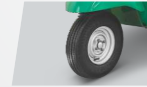
ट्यूबलेस टायर 3 व्हीलर श्रेणी में सबसे पहले