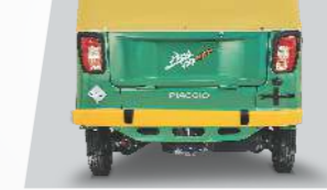
स्टायलिश रीयर बम्पर