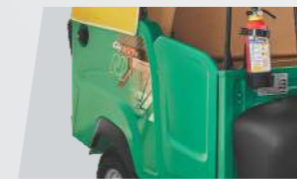
पैसेन्जर सेफ्टी डोर