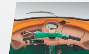
मल्टी इंफॉर्मेटिव डिस्प्ले