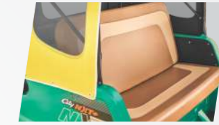
इयुअल टोन सीट्स