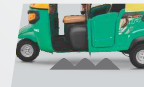
ऊंचा ग्राउंड क्लियरेन्स