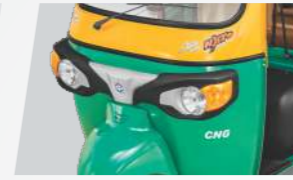
स्टाइलिश फ्रंट फैसिया