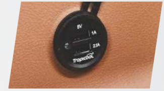
ड्युअल पोर्ट यूएसबी फास्ट चार्जर